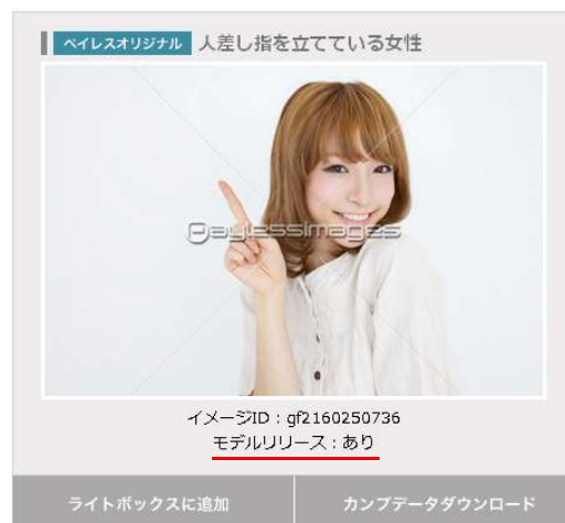
【プレビュー画面サンプル 1】