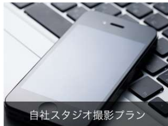
自社スタジオ撮影プラン

商品撮影やモデル撮影など用途に合わせた撮影プランをお選びいただけます。 ご希望のプランをクリックするとサービス内容や料金などを確認できます。