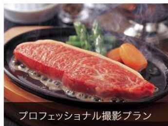
プロフェッショナル撮影プラン