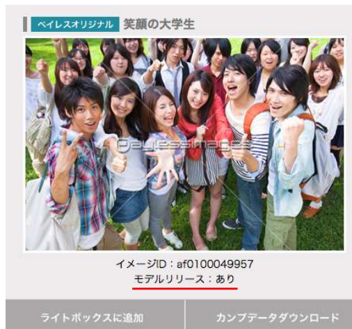
【プレビュー画面サンプル 2】