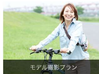
モデル撮影プラン